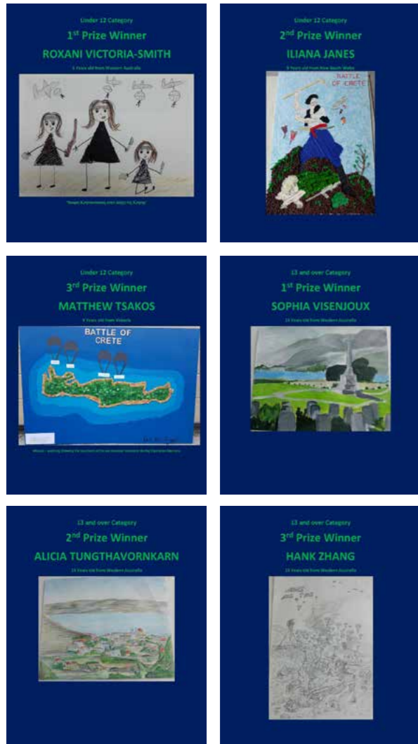
Photos from the exhibition of the Artworks