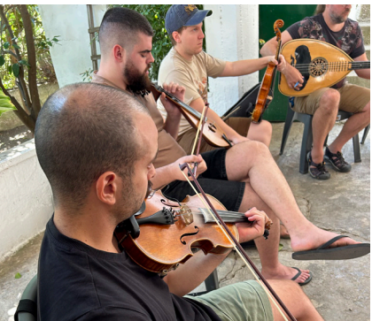
Musicians at the Merona Summer Music Camp learning to play the violin and lyra