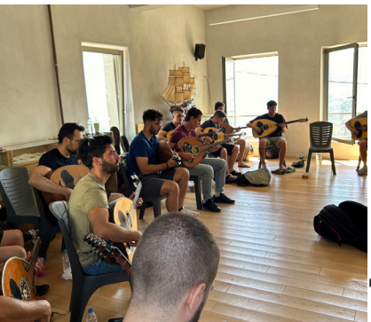
The Laouto class during the Merona Summer Music Camp