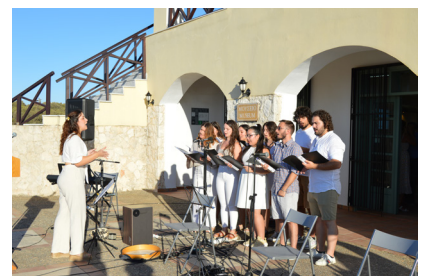
Student choral group from the Technical University of Crete