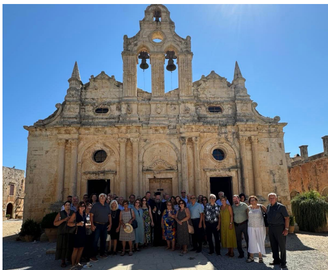
PAA members in front of the Arkadi Monastery Church