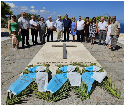
The World Council of Cretans Executive Committee and PAA members from around the country honor the memory of late Prime Minister Eleftherios Venizelos and his son Sophocles