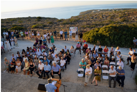
PEF Reception at the Botanical Park in Chania