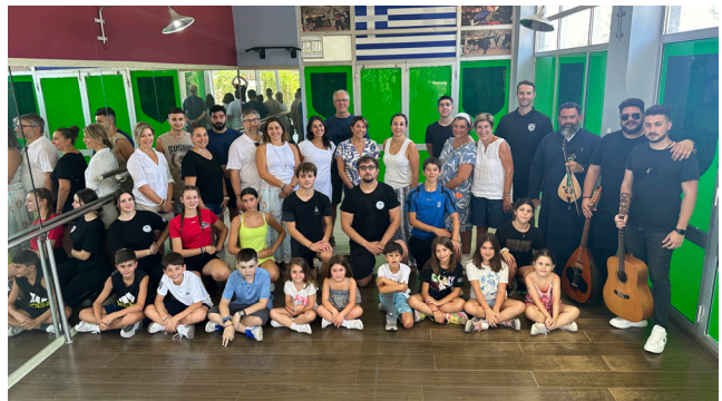
Cretan youth from Australia and Canada joined PAA members in the village of Alikianos for the second dance workshop with the Viglatores troupe