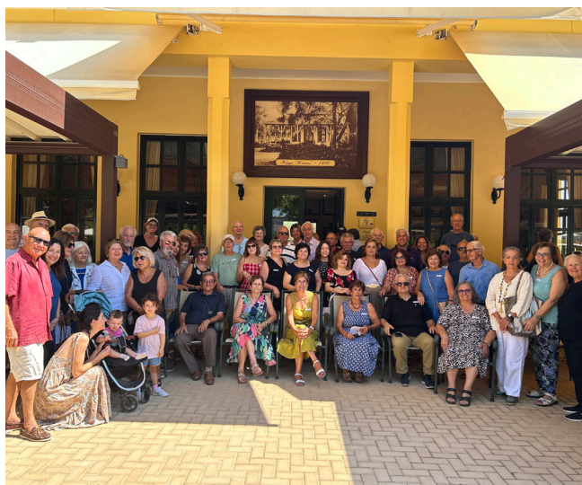
PAA Members from across the U.S. gather for coffee and breakfast at the historical Kipos Cafe in Chania