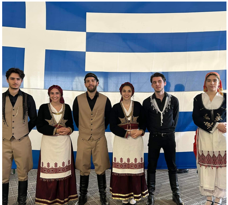
14 Ιουνίου 2024 Greek summer night στο NATO